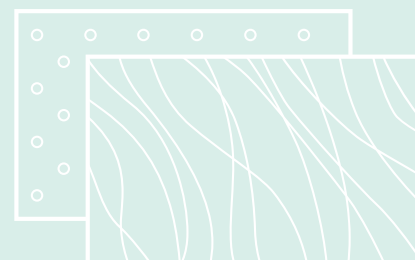
Enxerto de tecido com 4 camadas